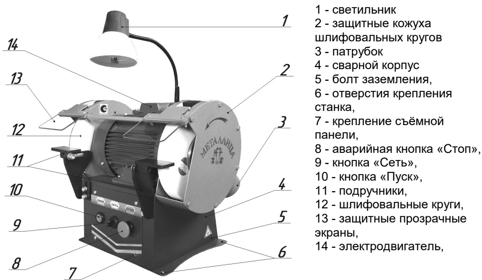
Рис. 2. Общий вид станка:

5.4. Перечень используемых стандартных и покупных изделий приведен в таблицах № 3,6.